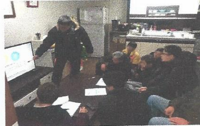
[2017년 연평대회 실시] 일시: 2017년 12월 28일(목) 장소: 공동생활가정 내

기관의 효율적인 운영을 위해서 실시되는 운영위원회가 12월 21일 비콘 2층 우당당당(강당)에서 개최되었습니다. 바쁜 연말 일정에도 불구하고 대부분의 운영위원들께서 참여해주셨고, 시설운영 및 2018년의 운영계획에 대해서 보고하는 시간을 가졌습니다. 시설의 개선점과 원으로 나아가야 할 방향에 대해 더욱 고민하는 시간이었습니다.