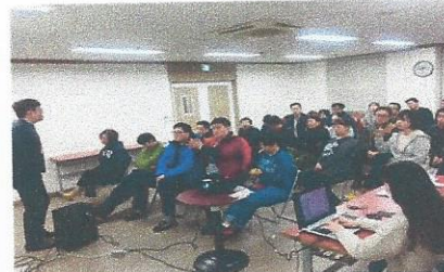
4분기 비콘 정책회의 진행 일시: 2017년 12월 21일 장소: 비콘 강당

비콘에서 4분기 가족교육이 진행되었습니다. 이번 주제는 3분기 가족교육 요구도 조사를 바탕으로, 가족분들께서 가장 궁금해 하시는 '독립 주거 서비스'에 대한 내용으로 교육이 진행되었습니다. 임대주택 보안 과정 및 독립준비에 필요한 실질적인 내용들을 바탕으로 교육 진행되었으며, 드림빌 희망빌 '그룹홈시설' 라운딩으로 교육을 마무리 하였습니다. 함께 귀한 시간 내어 주신 가족분들 감사드립니다!