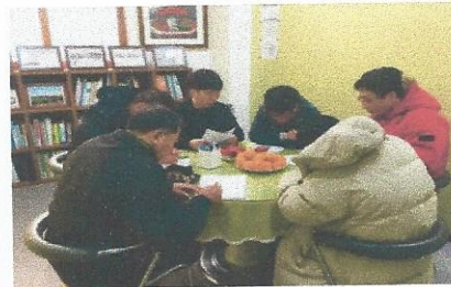
독립회원자조모임 '달밤의 싱글라이프'

2017년을 마무리하며 12월 21일, 회원들과 가족을 그리고 자원 봉사자들이 함께 모여 2017년을 되돌아보며 감사함을 나누는 시간을 가졌습니다. 송년의 밤에는 2017년 활동영상, 자원봉사 자 감사영상, 회원과 자원봉사자의 수기발표, 계명대 봄대 학생 들의 공연과 케플러 푸르기 등을 하였습니다. 송년의 밤 행사를 마친 후에는 모두 함께 음식을 나누어 먹으며 풍요로운 마음을 서로에게 전달하였습니다. 송년의 밤에 참가한 자원봉사자들은 '내년에도 We Wish You A Merry Christmas 노래 가사처럼 받 들이 여러분께 좋은 소식을 구석구석 가져다주고, 이 별들처럼 빛나는 한해 되시길 소망합니다.'라고 소감을 말하였습니다. 회 원들의 가족, 자원봉사자, 후원자와 2018년에도 함께 할 수 있 는 기회가 많았으면 좋겠습니다.