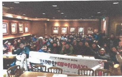
수성베네스트 송년회 「함께한데이(DAY)」

둘째 마지막 야외활동으로는 놀이동산을 가자는 회원들의 욕구를 반영하여 대구에 위치한 유명한 놀이공원에 다녀왔습니다. 날씨가 쌀쌀하여 몇몇 놀이기구는 운영을 하지 않았지만, 함께 온 고등학교생들과 함께 놀이기구를 타며 재미있는 시간을 보냈습니다!