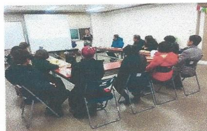
비콘 4분기 가족교육 진행! 일시: 2017년 12월 22일 장소: 비콘 강당

비콘에서 4분기 가족교육이 진행되었습니다. 이번 주제는 3분기 가족교육 요구도 조사를 바탕으로, 가족분들께서 가장 궁금해 하시는 '독립 주거 서비스'에 대한 내용으로 교육이 진행되었습니다. 임대주택 보안 과정 및 독립준비에 필요한 실질적인 내용들을 바탕으로 교육 진행되었으며, 드림빌 희망빌 '그룹홈시설' 라운딩으로 교육을 마무리 하였습니다. 함께 귀한 시간 내어 주신 가족분들 감사드립니다!