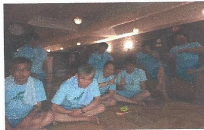
[공동생활가정 송년회 프로그램: 송구영신] 일시: 2017년 12월 22일(금) 장소: 대구CGV, 홀스피셜 등 외부

2017년은 '정신건강증진 및 정신질환자 복지서비스 지원에 관한 법률 (이하 '정신건강복지법')'으로 개정된 해입니다. 법이 개정되고 정신장애를 가진 회원분들이 지역사회로 복귀하기 위해서 지역사회 내외부에서 많은 노력들을 하고 있는 데요, 그 일환으로 드림빌에서는 금년에는 정신관련 기관의 종사자들이 모두 모여 모여 논의하는 제 1회 심포지엄에 다녀왔습니다. 차후 정신보건사업을 할 때 필요한 다양한 유익한 정보를 접하고 돌아올 수 있었던 시간이었습니다.