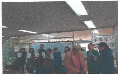
SDM & PEPS 수료식

위니스(Winess)란 이름은 We(우리)와 Ness(영사형)의 합성어로 "너와 내가 더불어 하나됨"이라는 뜻입니다. 대구위니스는 평등을 실천하여 정신장애인이라는 이유로 차별을 받지 않고, 정신적으로 힘든 분들이 고통을 받지 않도록 노력하고 있습니다. T. 053)352-0234 대구 북구 복산로 49 상미빌딩 3층