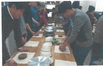
가족야유회 「첫눈처럼 가족! 너는 내 운명♡」

12월 단아모프로그램에서는 회원 위생관리를 위해 앞산 홍스파 월드에 다녀왔습니다. 위생관리라는 말에 가가싫어하는 회원들이 조금 있었으나, 가서는 또 금세 적응하고 재밌게 놀다왔다고 하네요! 개운하디며 즐거워하시는 회원들의 모습이 참 보기 좋았습니다.