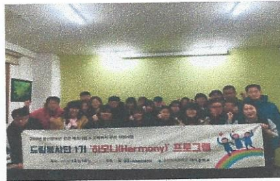
드림봉사단 1기 '하모니' 평가회

매서운 추위가 계속되는 12월 13일 베네스트마음건강센터에서 성성들 부장님 집단상담이 실시 되었습니다. 급성 '양성증상과 음성증상'이라는 주제로 진행되었습니다. 양성증상으로는 환청, 음성증상으로는 대인관계 위축에 대한 이야기가 많이 나왔습니 다. 약물 복용을 통해 양성증상을 치료해나가고 시설을 이용하 며 음성증상을 완화해나갈 수 있도록 노력해보자고 다짐해보았 습니다. 자신의 경험을 공유하며 서로 상호작용하는 시간이 되 었습니다. 2018년에도 지속적인 집단상담을 통해 치료와 재활 에 한 발 더 나아갈 수 있도록 노력하겠습니다.