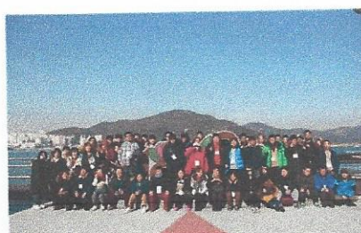
여수, 순천으로 떠나요- 비콘 액션플랜워크숍 실시! 일시: 2017년 12월 14일~12월 15일 장소: 여수, 순천

매 분기별로 실시되는 정책 회의록 통해 클럽하우스 운영에 대한 효율적 방안과 방향성을 함께 모색해 보는 시간을 가졌습니다. 이번 정책회의 시간에는 회원분들이 필요로 하는 프로그램 및 서비스에 대한 내용을 많이 들을 수 있었습니다. 여성 회원분들의 경우, '미용 및 뷰티 관련 프로그램'에 대한 욕구가 있었고, 남성 회원분들의 경우, 클럽하우스 시설이나 만큼 자발성을 원 회원 주도 프로그램이 새롭게 편성되었으면 한다는 좋은 의견이 있었습니다. 2018년도 사업계획 시, 이러한 내용을 참고하여 회원들의 의견이 적극 반영된 프로그램이 개설될 수 있도록 노력하겠습니다!