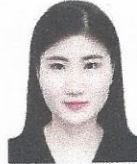
대구위니스 신규 정신보건임상심리사 일사