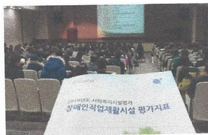
2019 장애인직업재활시설 시설평가 지표 설명회 참석

http://apsanbenest.wixsite.com/apsanbenest