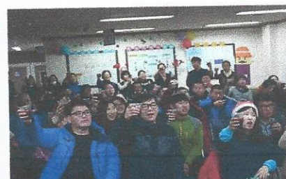
비콘의 빛나는 밤, 송년회 실시하다! 일시: 2017년 12월 22일 장소: 베네스트 비콘