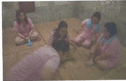
수성베네스트 자조모임 단아모 「뽕질방」