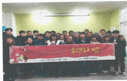
2017년 송년의 밤 '한끼에서 즐거운 밤'

출처한 화창했던 12월 16일 아동청소년사업 드림봉사단 1기 - 하모니 'Harmony' 평가회가 진행되었습니다. 드림봉사단 활동 평가, 활동수기발표 및 성장견찰, 활동동영상, 축약공연을 보며 사업을 마무리 하였습니다. 회원분들은 드림봉사단 활동을 통해 '새로운 사람을 만나는 것'에 대한 두려움을 해소할 수 있었 다. 학생들은 '정신질환에 대해 이해하고 편견을 없앨 수 있는 시간이었다.'라고 평가하였습니다. 내년에도 드림봉사단 2기가 이어질 수 있도록 노력하겠습니다.